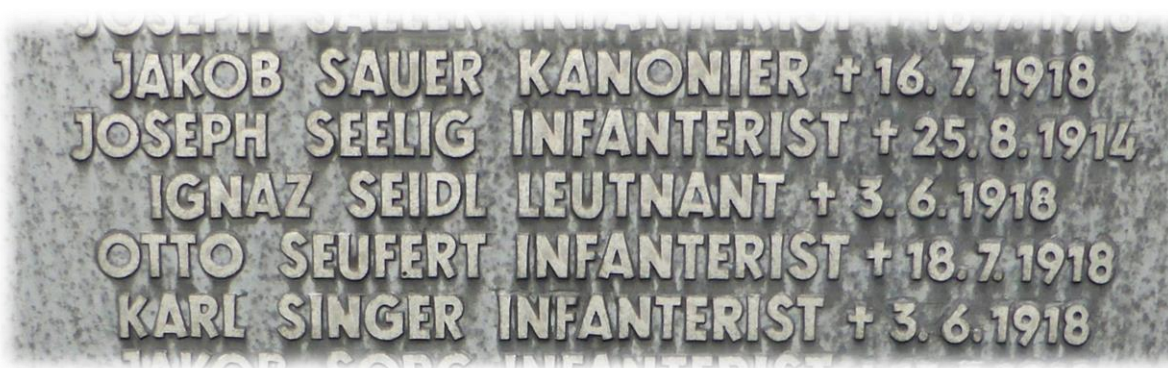
Die Namensplatte des Kameradengrabes auf dem deutschen Soldatenfriedhof in Marfaux