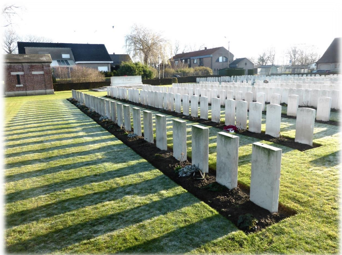
Grab von Oberleutnant Ritter von Schredinger, etwa Mitte der vorderen Reihe, auf dem englischen Soldatenfriedhof Ypern Duhallow (die Grabsteine sind leider sehr ausgewaschen und individuell schlecht lesbar)