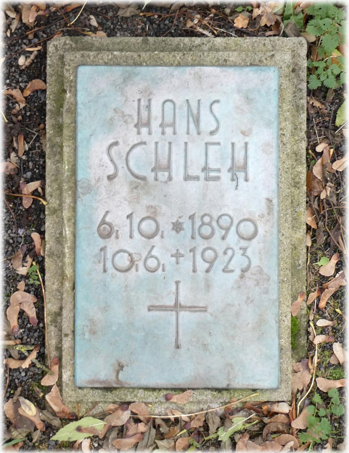
Eine der sechs Grabplatten