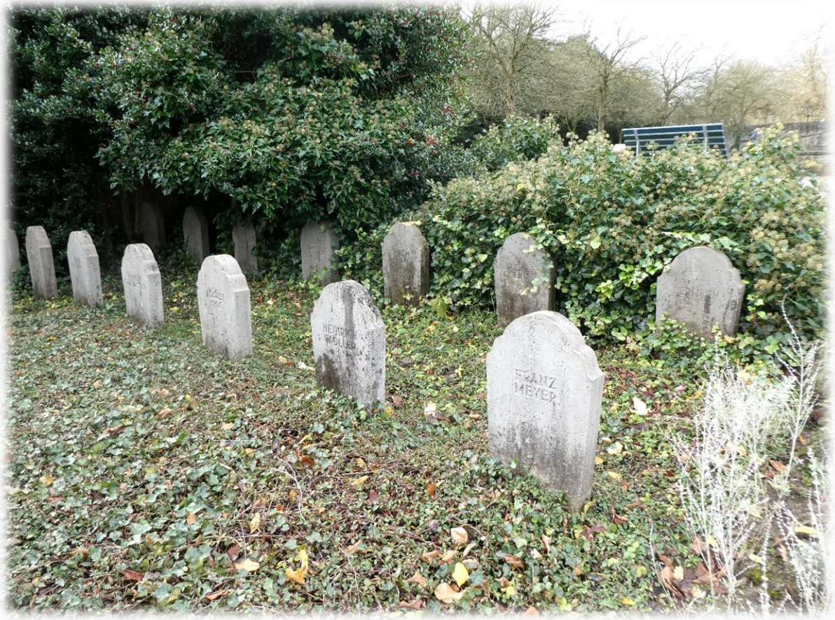
Ein Teil des Gräberfeldes auf dem Hauptfriedhof Dortmund

Wir geraten nun etwas außerhalb des eigentlichen Themas „Ehrenmal Bayern“, jedoch mag auch nachstehendes für den einen oder anderen Leser interessant sein: