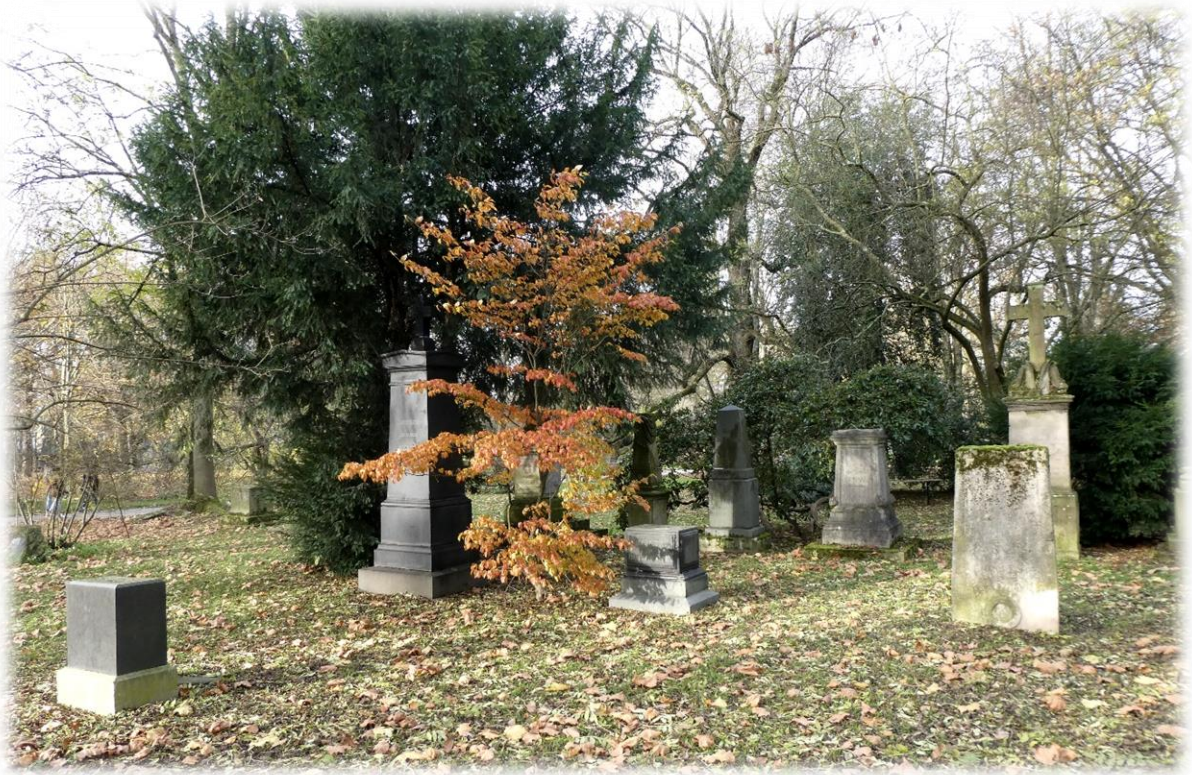
Die im Park drapierten zivilen Grabsteine

Nachfolgend drei Bilder des Denkmals für den Einigungskrieg 1866