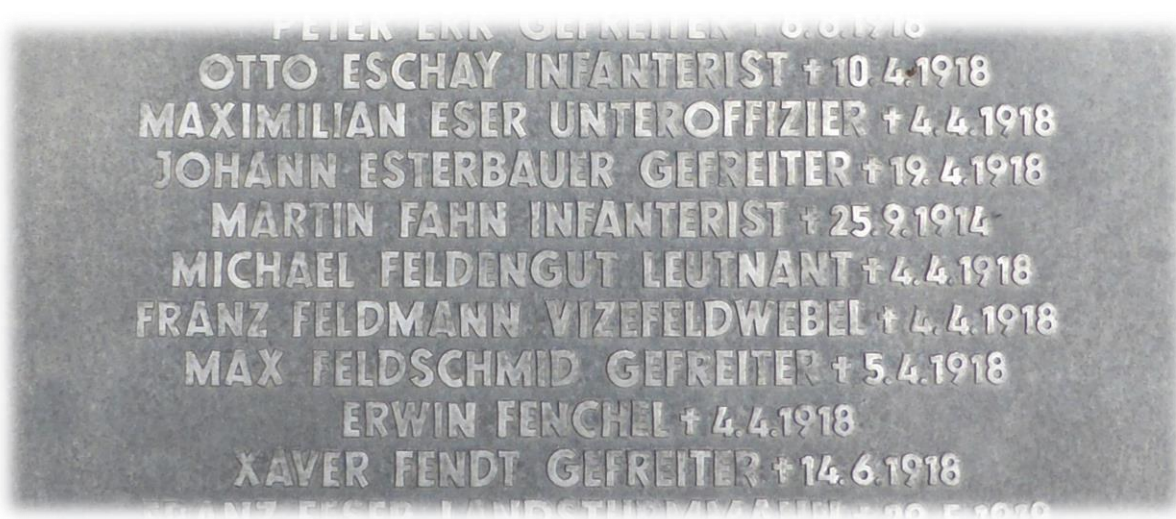
Namensplatte des Kameradengrabes auf dem deutschen Soldatenfriedhof Montdidier