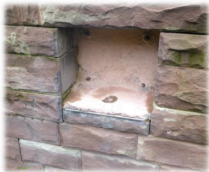
Herausgebrochene Buchlade in Troyon