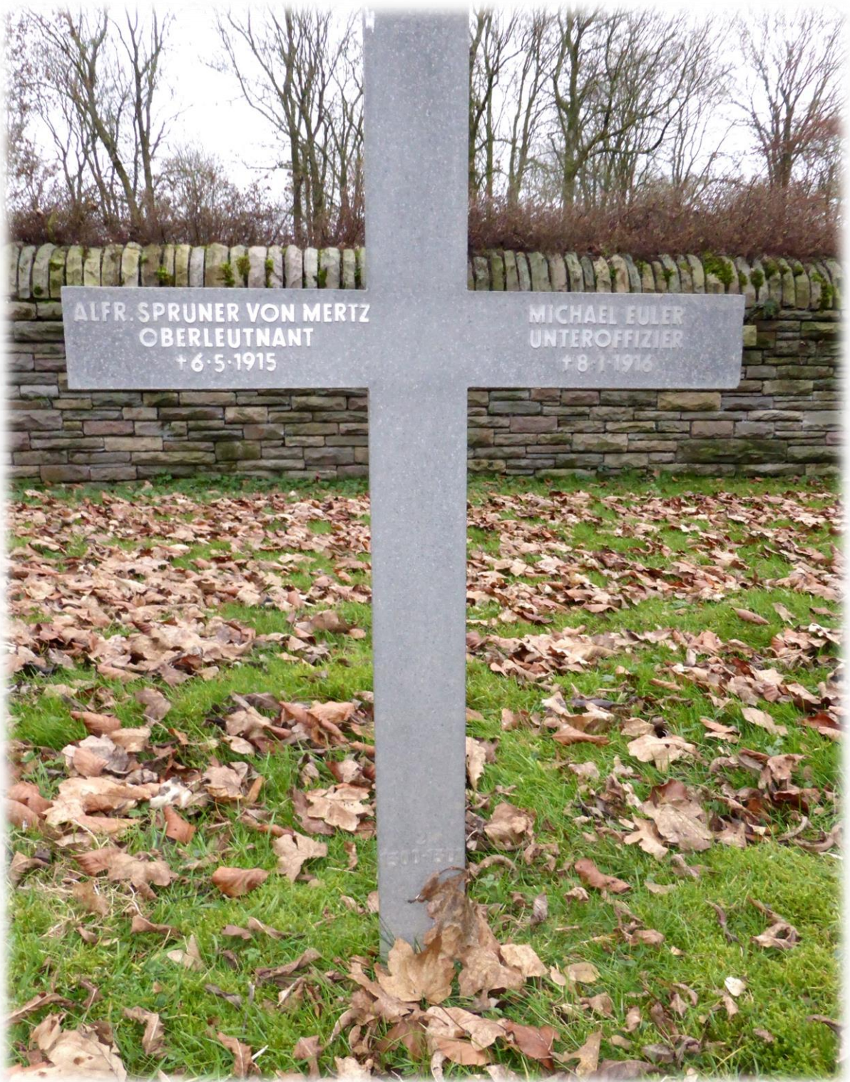
Sein Grab auf dem deutschen Soldatenfriedhof St. Laurent-Blangy, Département Pas-de-Calais