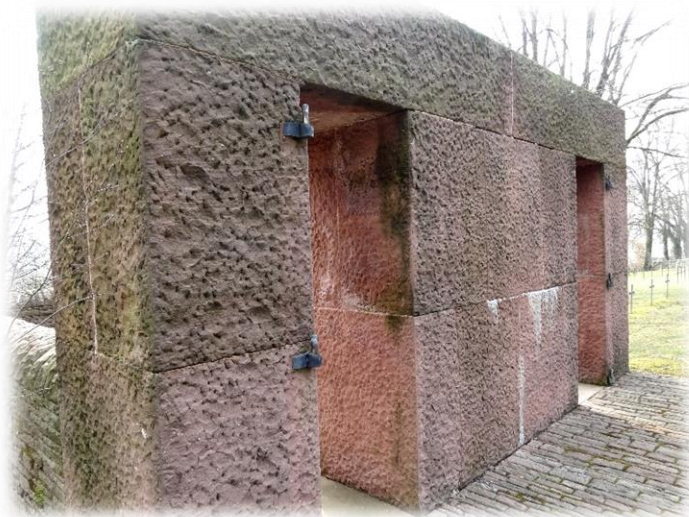
Gestohlene Eingangsportale in Briulles-sur-Meuse

Weitere Beispiele für die damaligen Friedhofsdiebstähle: