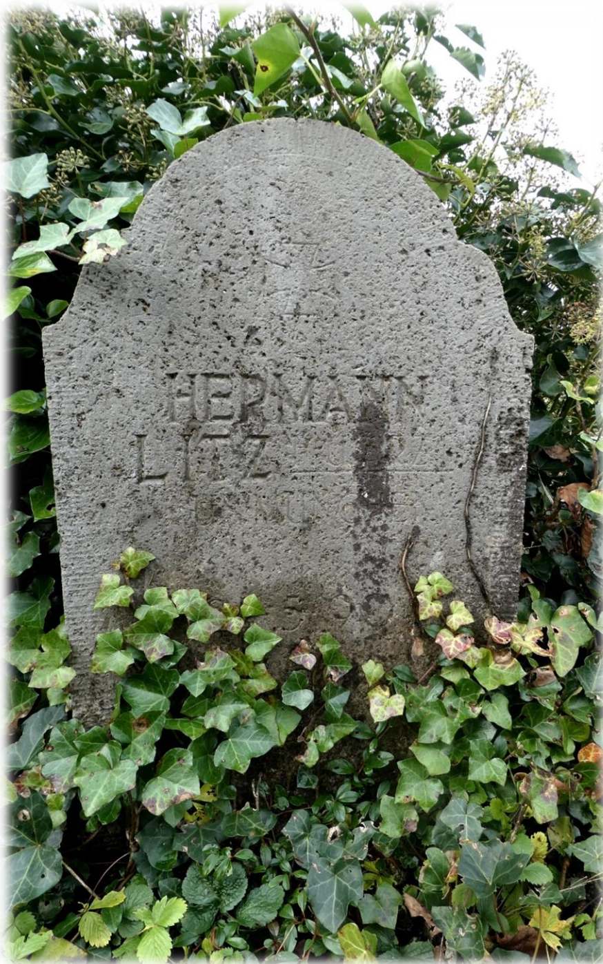
Das heutige Grab auf dem Hauptfriedhof Dortmund

Die Kriegsgräber wurden auf den Dortmunder Hauptfriedhof verlegt.