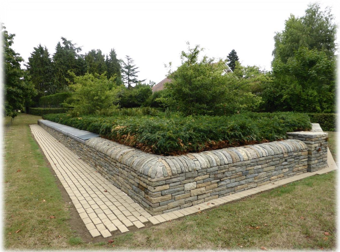
Das Kameradengrab in Montdidier mit mehr als 3.700 Gefallenen